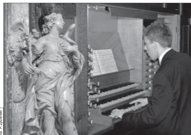
fol. P. Zyczeński

Powiedziawszy to, uśmiechnął się szeroko niczym Pan Słoneczko i zniknął odwołany do pilniejszych zajęć. Albert pomyślał, że skoro wierni zakrzy-