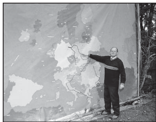
fol. B. Nowak